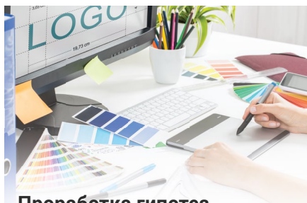
Проработка гипотез и визуализация