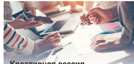
Креативная сессия с командой