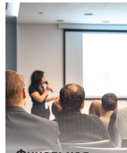
Финальная презентация решения