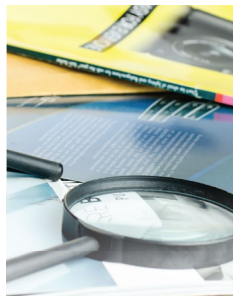
Исследование сферы и особенностей