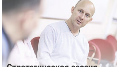
Стратегическая сессия с руководителем